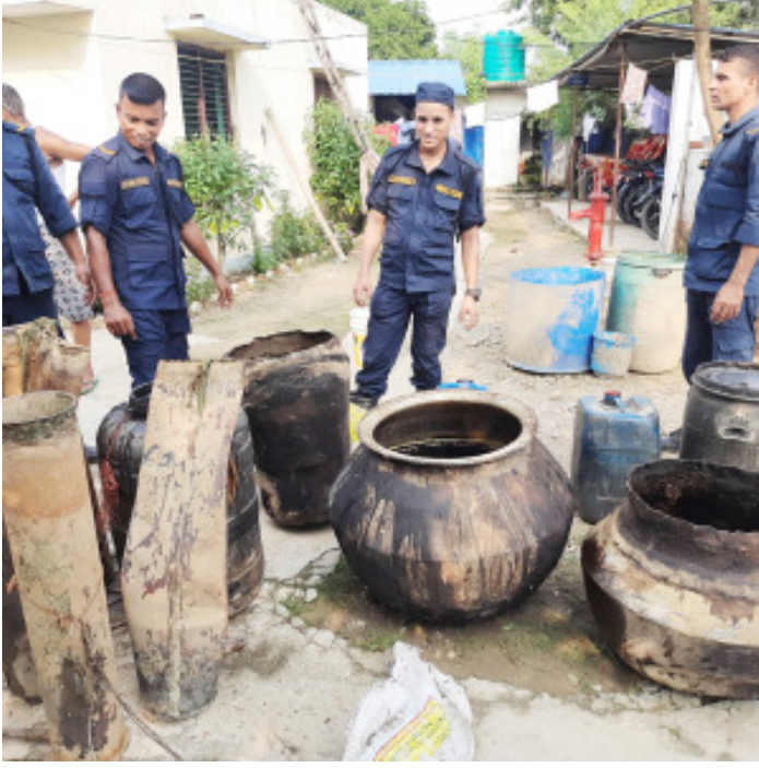
घटना न्यूनीकरण गर्ने उद्देश्यले घरेलु मदिरा विरुद्ध कारवाही थालिएको जिल्ला

प्रहरीले गत भदौ १९ गते सिम्रौगढ र पचरौता नगरपालिका तथा बारागढी गाउँपालिकाका विभिन्न स्थानका भट्टीमा छापामारी गरेको हो । मदिरा उत्पादन, खुल्ला विक्री वितरणसँगै बढेको घरेलु हिंसा, बालबालिका विरुद्ध हुने अपराध र सवारी दुर्घटनाका जस्ता